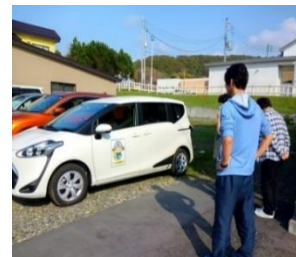
しよさまる号の試運転